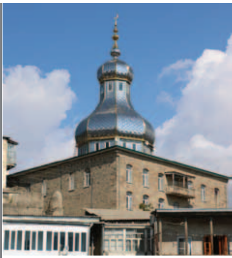
№42 (8699), арбе

Совещанидал райондин образованидин идараяр хъуьтIуъз гъазурлухвилин, 17-октябрдиз райадминистрацияда агъсакъалрин Советдин заседание тешкилуниз, 21-октябрдиз РДК-дин залда Лезги театрдин тамаша къалур-завайвилин (билет – 200 манат) ва бязи маса месэляйризни дикъет гана.