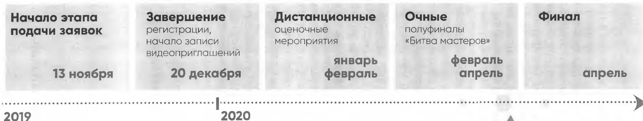
ГРАФИК ПРОВЕДЕНИЯ КОНКУРСА