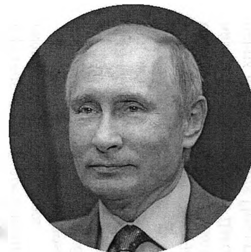
В. В. Путин

« Мы должны сделать всё, чтобы ведущие представители мировой туристической индустрии осознали, как велик туристический потенциал нашей страны, что у нас есть все основания быть в числе лидеров международных рейтингов самых востребованных путешествий на планете »